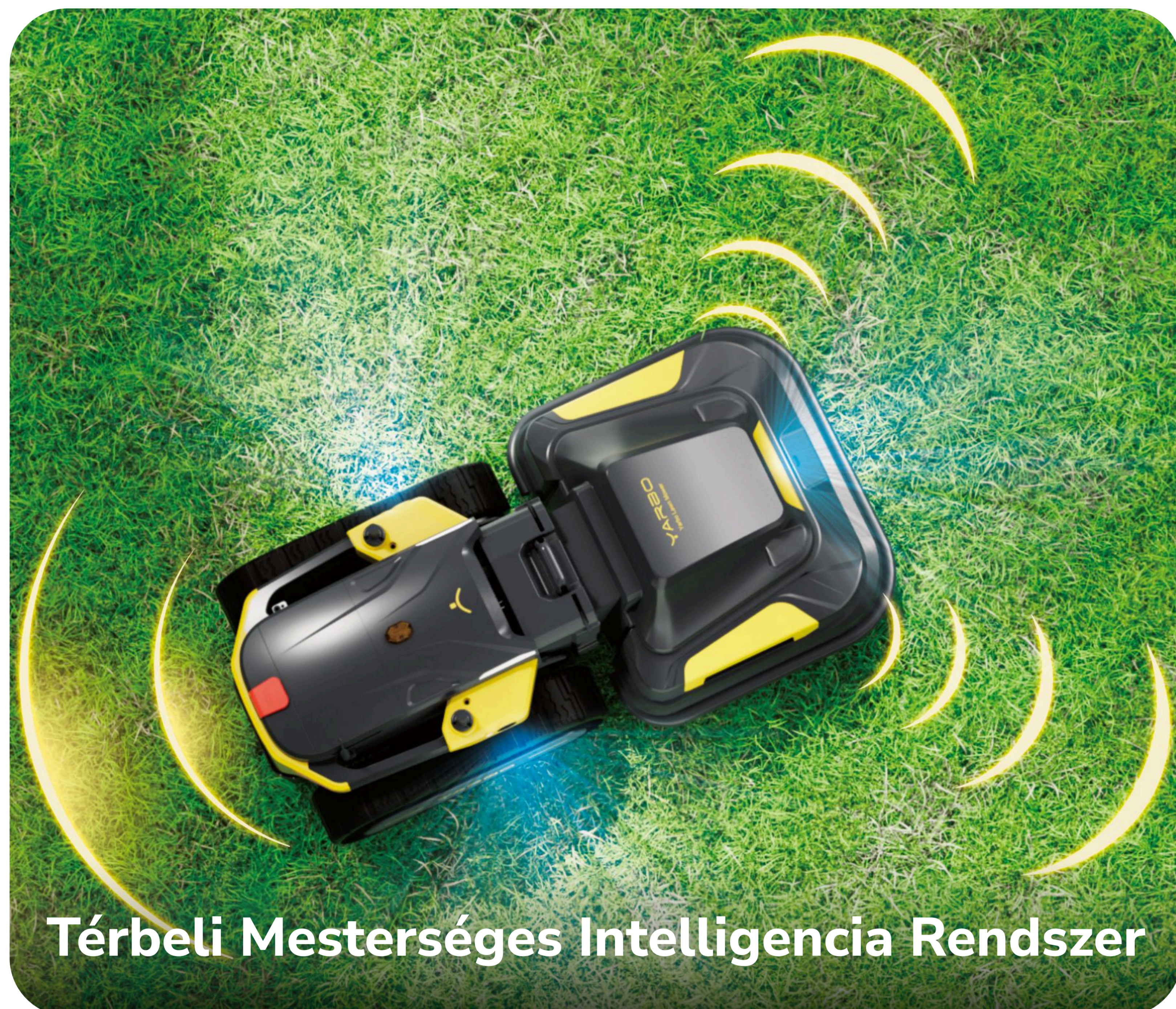
Térbeli Mesterséges Intelligencia Rendszer

A YARBO térbeli AI rendszere 6 kamerát, 2 ultrahangos szenzort, háromrészes első ütközőt és fejlett AI-algoritmusokat integrál a pontos akadályfelismeréshez és -elkerüléshez.