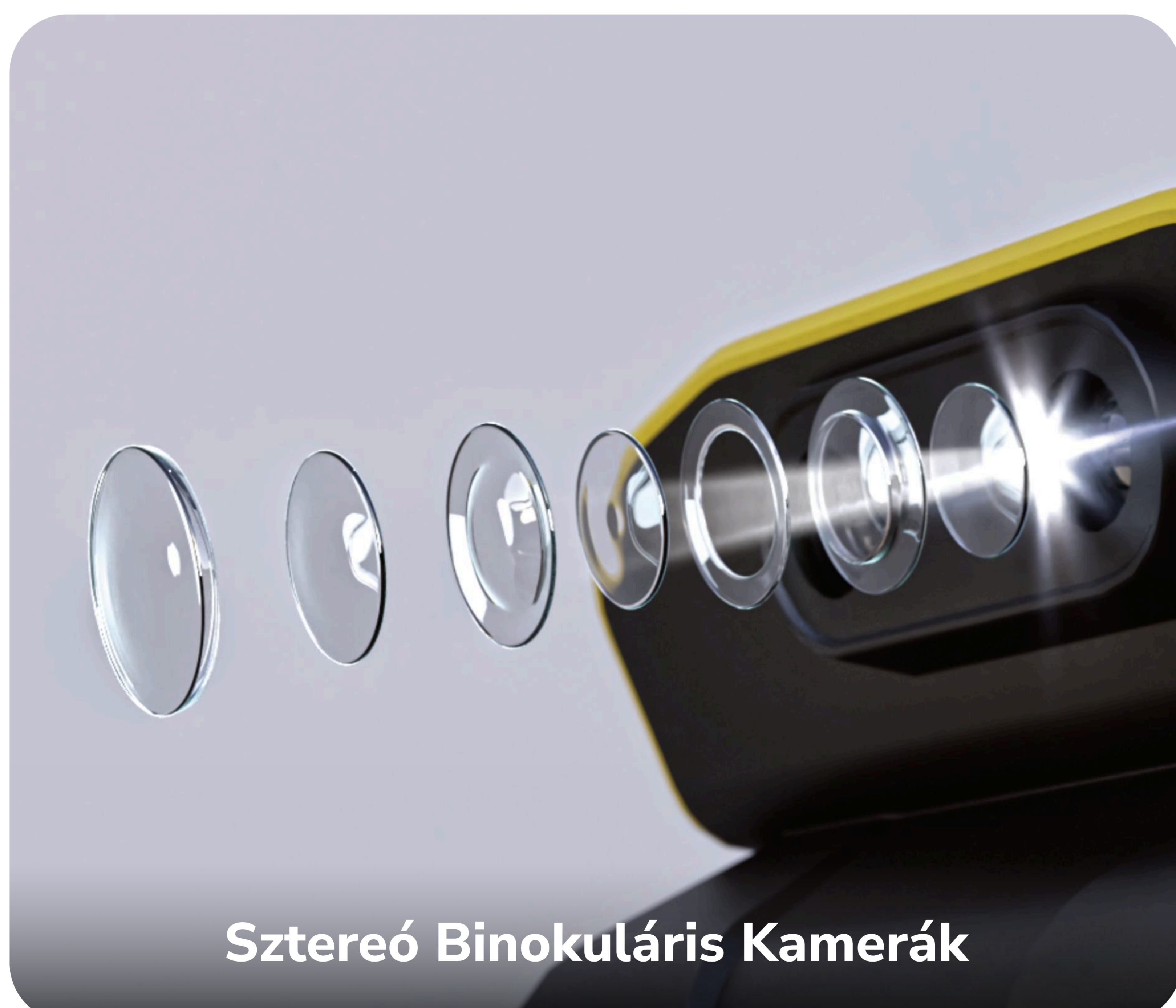
Sztereoó Binokuláris Kamerák

A YARBO intelligens látórendszere gondoskodik az emberek és háziállatok biztonságáról, miközben védi a környezetet és a tulajdont.