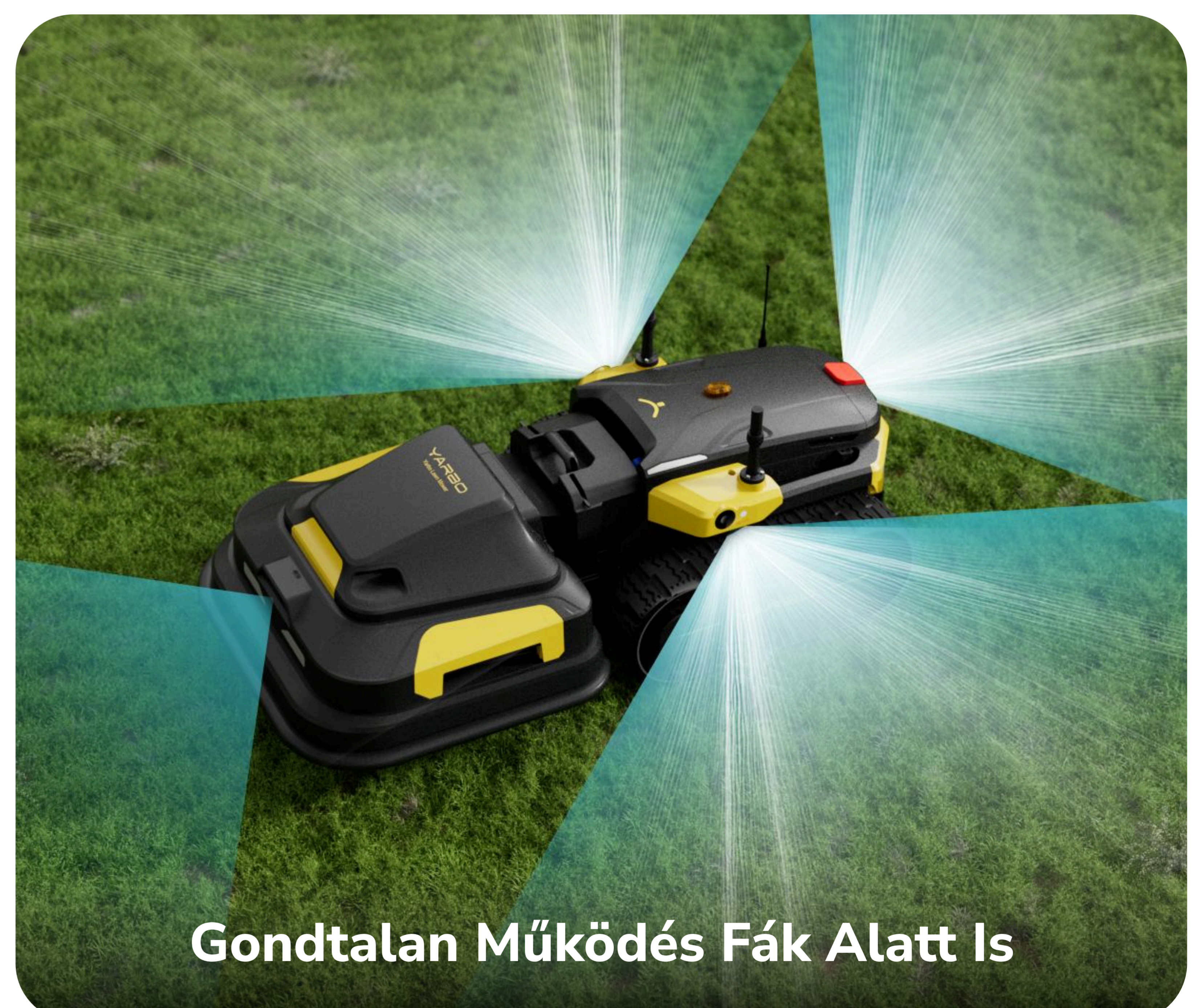
Gondtalan Működés Fák Alatt Is

A sztereó látás lehetővé teszi a jelenetfelosztást, az automatikus határfelismerést, a megbízható térképezést és a pontos útvonalkövetést, valamint a precíz akadályérzékelést.